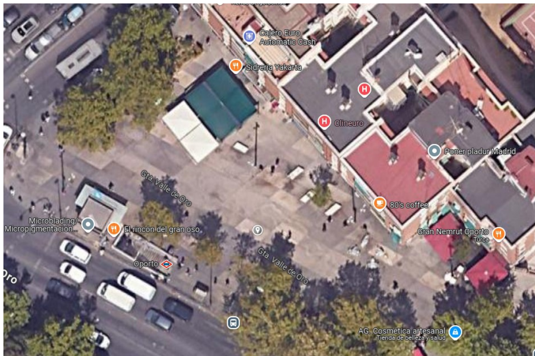
Zona de Glorieta Valle de Oro