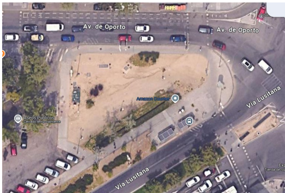
Zona Avenida de Oporto con Vía Lusitana